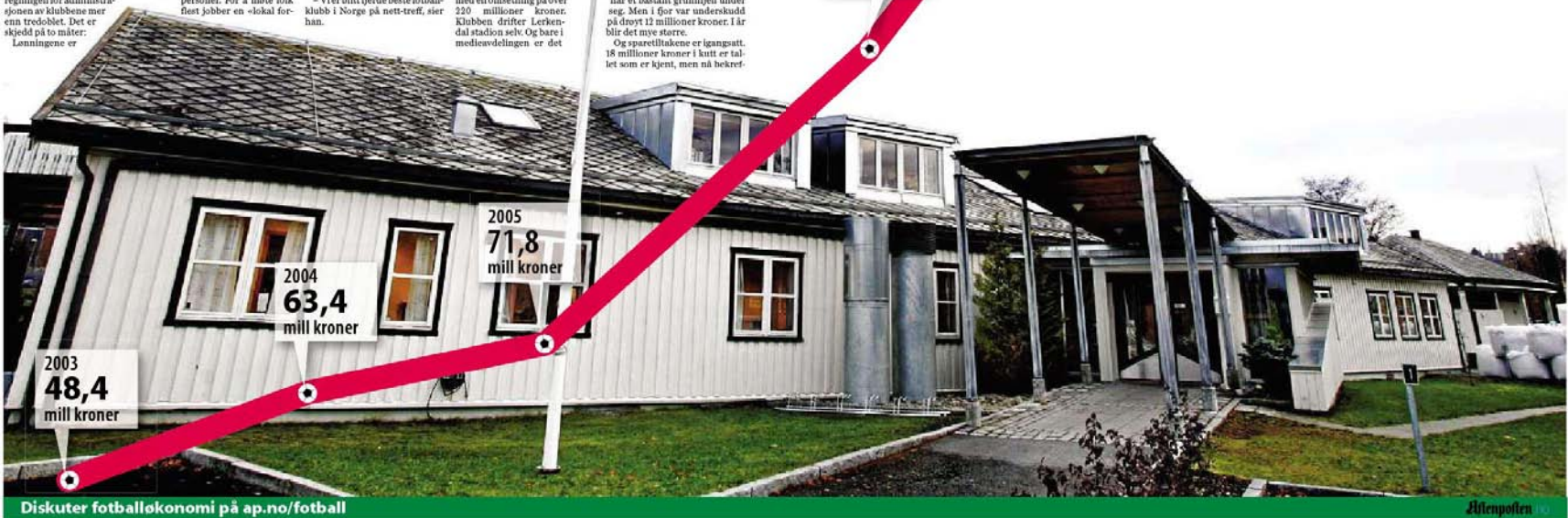
Diskuter fotballøkonomi på ap.no/fotball