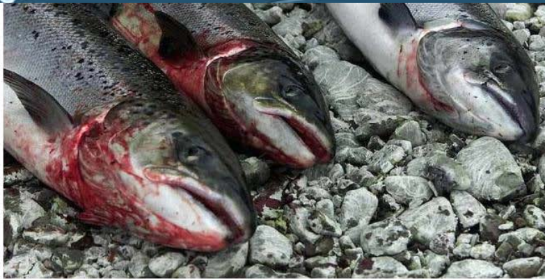
Syk laks.